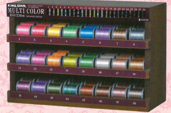
専用陳列ケース SLM-MC 全24色×3個